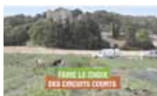
Vidéo «Faire le choix des circuits courts»